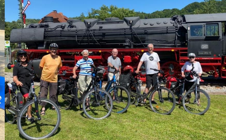
Gemeinsame Fahrradtour im Juni 2022