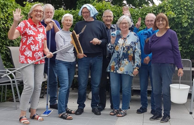
Gemeinsames Putzen im Mai 2022