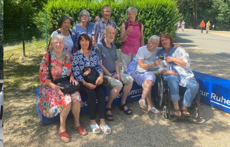
Besuch der Ausstellung "Das zerbrechliche Paradies" im Gasometer in Oberhausen im Juni 2022